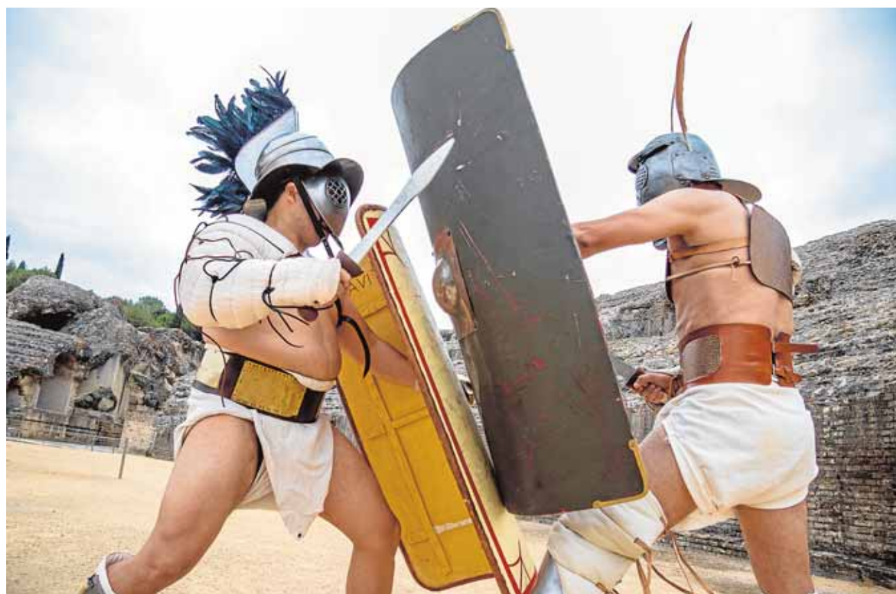
Dos de los «gladiadores» de «Hispania Romana» que actuarán este sábado en el anfiteatro de Itálica

«Hendrix» o «Morón Rock» canalizan esta nueva creatividad musical que está sirviendo de cantera para las bandas emergentes de rock sevillanas. Este sábado se darán cita en Morón. [2]