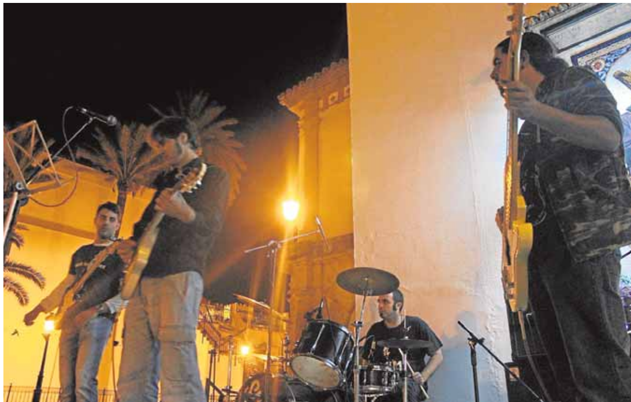
Los «Stinkis» es uno de los grupos emergentes, junto con «Balanegra», «Deviante» o «Not For The Mass» L. MÁRMOL

namiento ha sido trabajo nuestro. Preguntados por la motivación de la asociación, la respuesta es bastante clara: divulgar y difundir la música rock y ofrecer una alternativa de ocio para los vecinos, independientemente de su edad. Por ejemplo, Isi creó una escuela de rock «de cero a noventa y nueve años», afirma entre risas. También organizan festivales, conciertos y eventos para poder ir sacando algún ingreso con el que mantener la asociación, que resaltan, no tiene ánimo de lucro. Además, «estamos ahí para lo que necesite cualquier colectivo que requiera de nuestra ayuda, ya sea para algún concierto, para montar una barra o simplemente aportando capital humano», demostrando así que no les dan locales solo porque toquen unos instrumentos de vez en cuando.