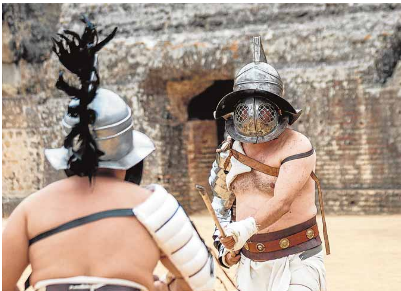
Dos de los «gladiadores» de «Hispania Romana» que actuarán el sábado en el anfiteatro de Itálica DANIEL GONZÁLEZ ACUÑA

motivo de la clausura de la edición 2014/2015 del programa Parlamento Joven. Los jóvenes disfrutaron de una gymkhana cultural, un pleno en la Diputación Provincial y de actividades lúdicas en el parque de María Luisa.