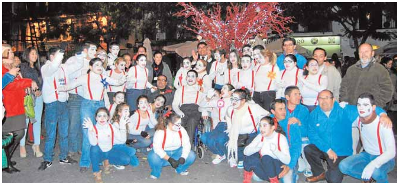
Miembros de la asociación utrerano Apdis tras una de sus exitosas representaciones teatrales