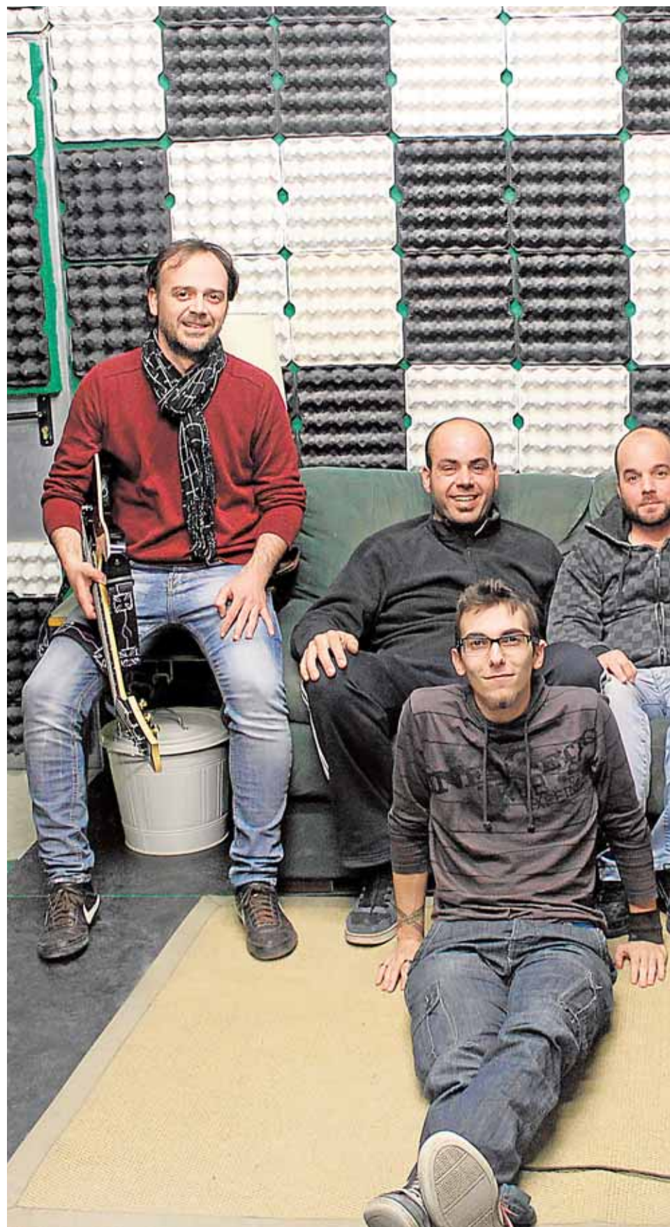
Miembros veteranos de la asociación «Hendrix» con miembros de la nueva generación

Escuelas de rock Uno de los principales objetivos de las nuevas asociaciones es recordar que el rock es cultura