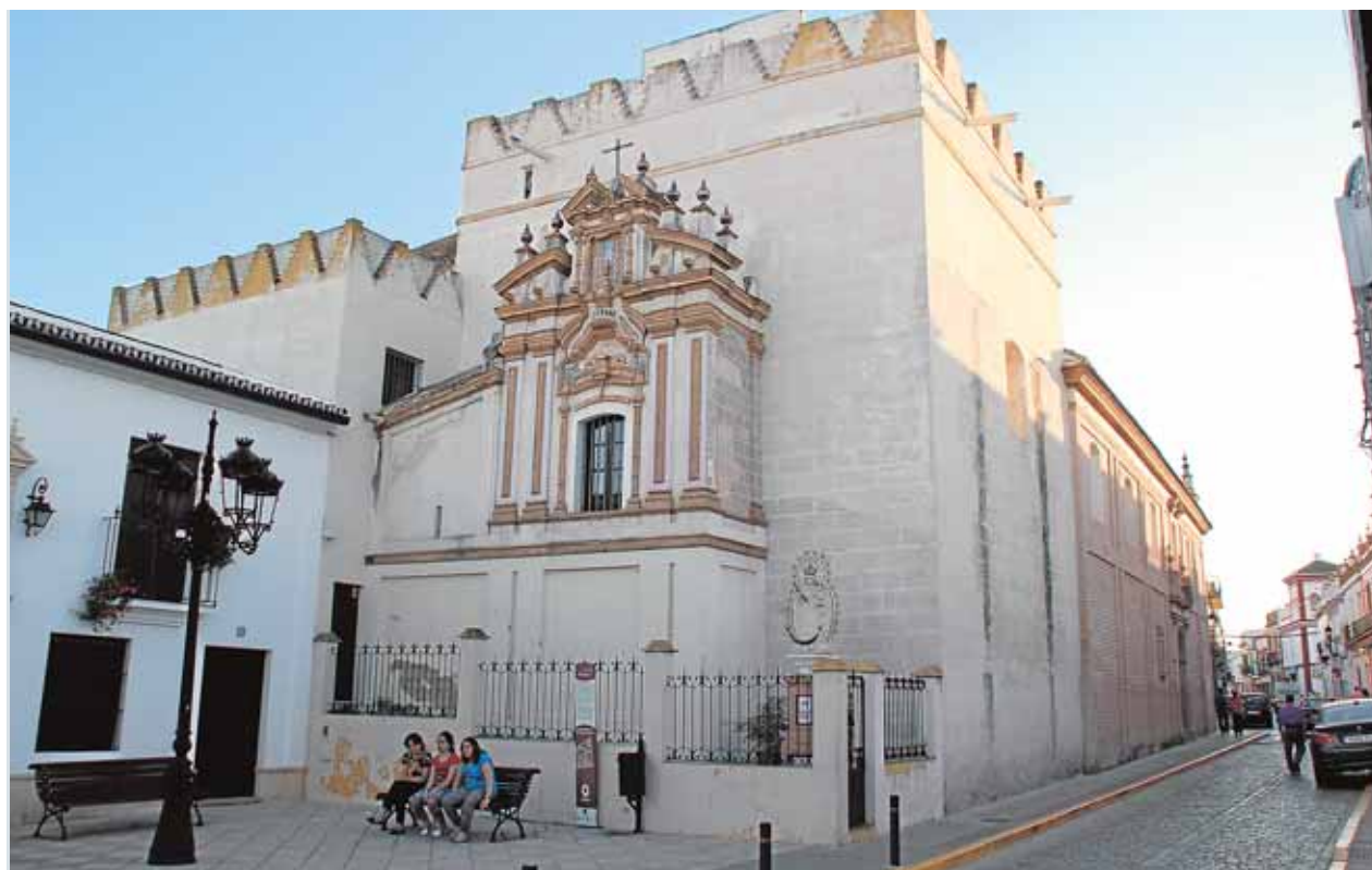
Torre mocha, adosada a la iglesia parroquial de Nuestra Señora de las Nieves, en Benacazón

Jueves 18. Salón de Usos Múltiples de Albaida del Aljarafe. 20 horas. Entradas: 1,50 euros