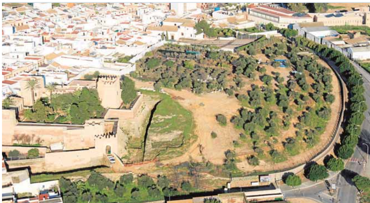
Los nuevos jardines se convertirán en el espacio verde más relevante de Mairena del Alcor