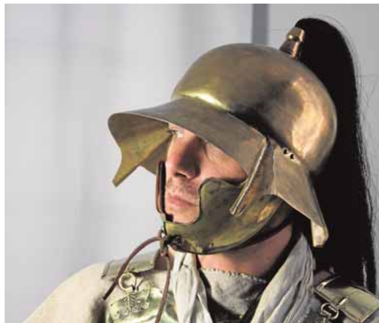
Representación de la ropa que se utilizó en Baecula o Ilipa ABC

El Hospital de la Merced de Osuna ya dispone de 158.000 historias clínicas de sus pacientes en versión digital. Dicha documentación está accesible desde el pasado mes de mayo, en el que se terminaron las últimas digitalizaciones. A lo largo de 8 meses, 20 personas han procesado la información de nueve millones de documentos, lo que supondrían unas 700 toneladas de papel, a través de escáneres de alto rendimiento y con un software específico. La información digitalizada se incorpora de esta forma a la historia de los usuarios, evitando la posibilidad de fallos en su localización y liberando unos 400 metros cuadrados del hospital. B.M.