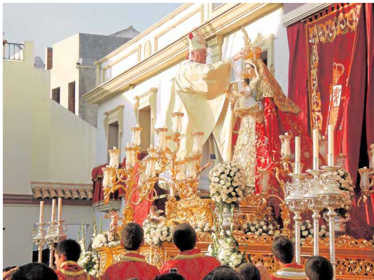
El cardenal y arzobispo emérito de Sevilla, Carlos Amigo, coronó canónicamente a la Virgen en 2009

El cardenal y arzobispo emérito de Sevilla, Carlos Amigo, presidió en mayo de 2009 la coronación canónica de la Virgen del Rosario en un multitudinario acto celebrado en la plaza del Ayuntamiento que fue seguido por miles de personas y decenas de hermandades andaluzas invitadas.